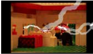
Die Superhelden (2:39 min)

Musikvideo | Chorklasse des Justu-von-Liebig-Gymnasiums | Veronika Wersin | Neusäß 2017