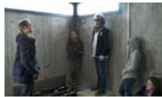
Gemeinsam sind wir stark (6:39 min)

Eine fiese Clique mobbt und erpresst schwächere Schüler und zwingt sie, gefährliche Dinge zu tun. Bis sich ein Kind nicht mehr einschüchtern lassen will. Ein Film gegen Mobbing.