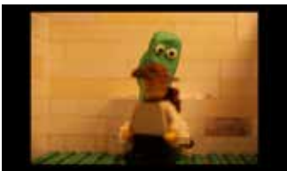
Das Monster aus der Toilette (4:10 min)

Spielfilm | Moviebande Nördlingen | Dieter Scholz | Nördlingen 2015