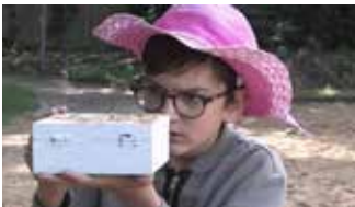
Die Kiste (16:48 min)

Animationsfilm | Grundschule Graben Gruppe 2 | Matthias Schäfer | Graben 2017