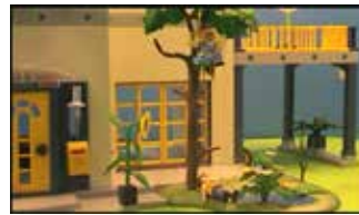
Der letzte Wunsch (2:39 min)

Spielfilm | Die Tarantinos | Elena Plockross | Augsburg 2017