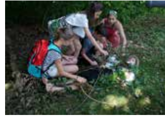
Der Fluch des Herzens – In Stein gefangen (10:56 min)

Sonstiges | Yvonne Tippelt | Langweid 2017