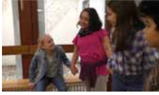
Musik ist unser Zuhause (13:00 min)

Vier verschiedene Schüler erleben an einem gewöhnlichen Schultag unterschiedliche Enttäuschungen wie Mobbing, Liebeskummer, Schulstress oder Agression durch Andere. Durch die Musik werden sie wieder froh und finden als Gruppe zusammen.