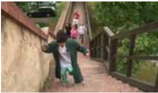
Jagd durch die Dimensionen (8:53 min)