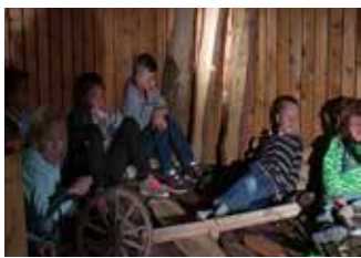
Der letzte Schokoriegel (14:00 min)

Animationsfilm | Grundschule Graben Gruppe 1 | Matthias Schäfer | Graben 2017